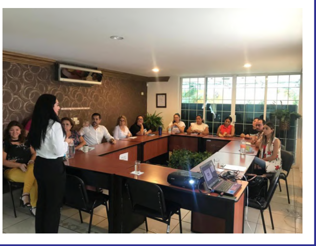
Taller muy interesante sobre la Responsabilidad de los Servidores Públicos, Discriminación e Inclusión.