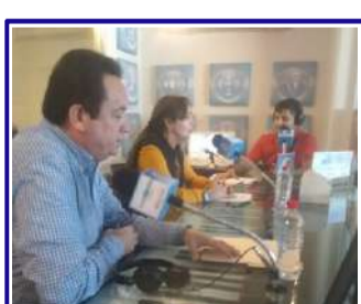
Casa del Estudiante de Cosalá, IAP

Maxi Radio - Radio Sinaloa Radio Maria - Canal 3 Radio Uas