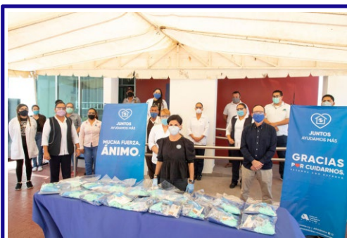
Centro de Salud Urbano Navolato