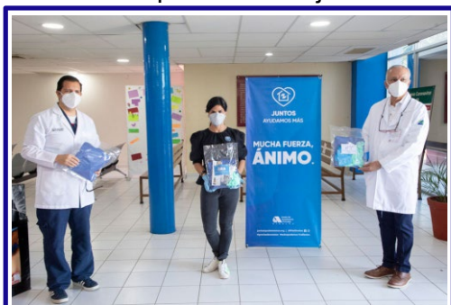
Hospital de la Mujer